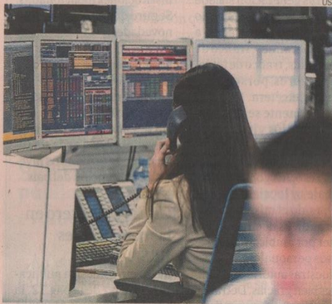
En azul, 141 opciones brindaron retornos positivos en enero.