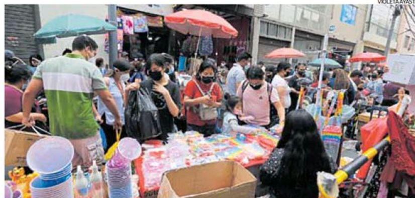
Trabajadores. Los que laboran informalmente viven del día a día y difícilmente piensan en una pensión.

Para el exsuperintendente de AFP, Enrique Díaz, el sistema de pensiones peruano está